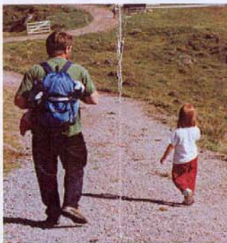
Diverse gut ausgebaute Wanderwege.