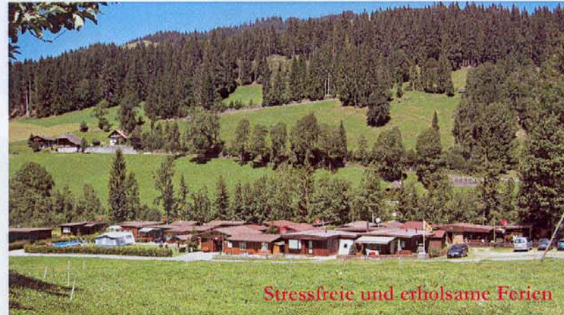
Stressfreie und erholsame Ferien

Wo die Natur unbeschädigt und die Luft noch rein ist.