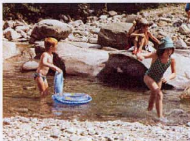
Erfrischendes Bad in der Emme.