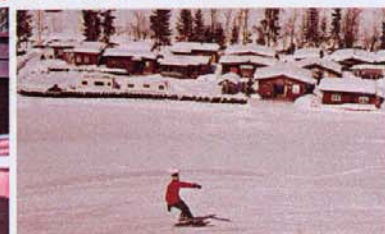
Langlaufloipe Bumbach - Kemmeriboden. 10 Km maschinenpräpariert für Klassisch und Skating.