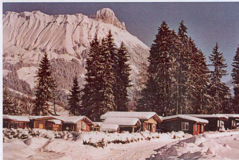
Schrattenfluh mit Schybegütsch