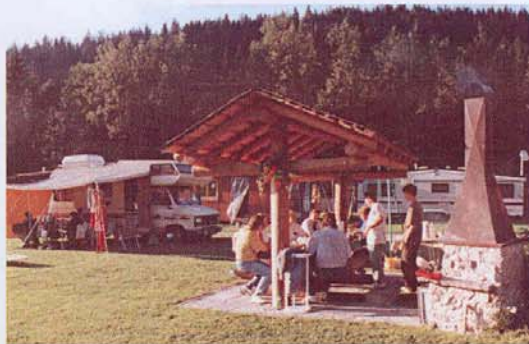
Gemütliches Beisammensein in heimeliger Atmosphäre.