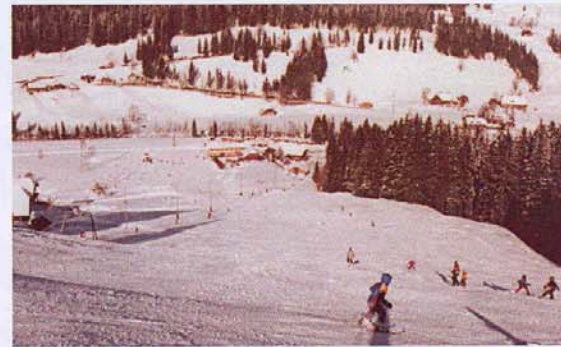
2 Skilifte und ein Kinderlift Total 2280m Länge 920m-1240m ü.M.