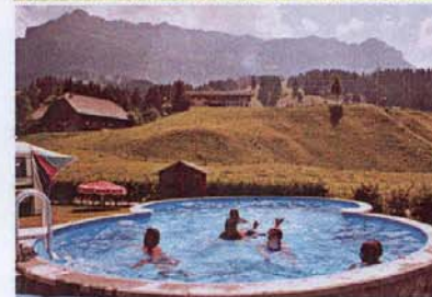
Schöner Pool mit Sicht auf den Hohgant. Krone des Emmentals (Gotthelf)

Der Campingplatz am Emmeufer ist ideal für aktive und erholsame Familienferien. Er verfügt über gut eingerichtete Sanitäre-Anlagen und ist auch für Tagestouristen bestens geeignet. Wintergäste befinden sich direkt im Langlauf- und Skigebiet.