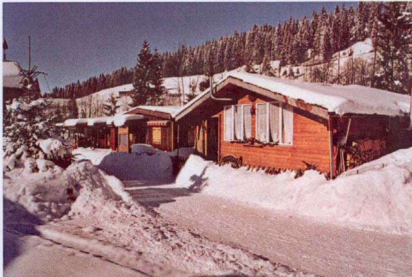
Liegt direkt am Fusse des Skilifts und direkt an der Langlaufloipe.