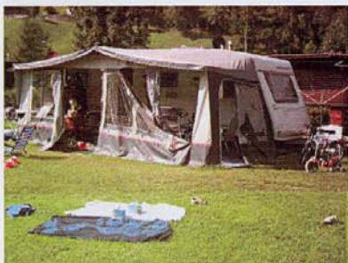
Zelt- und Wohnwagenplätze.